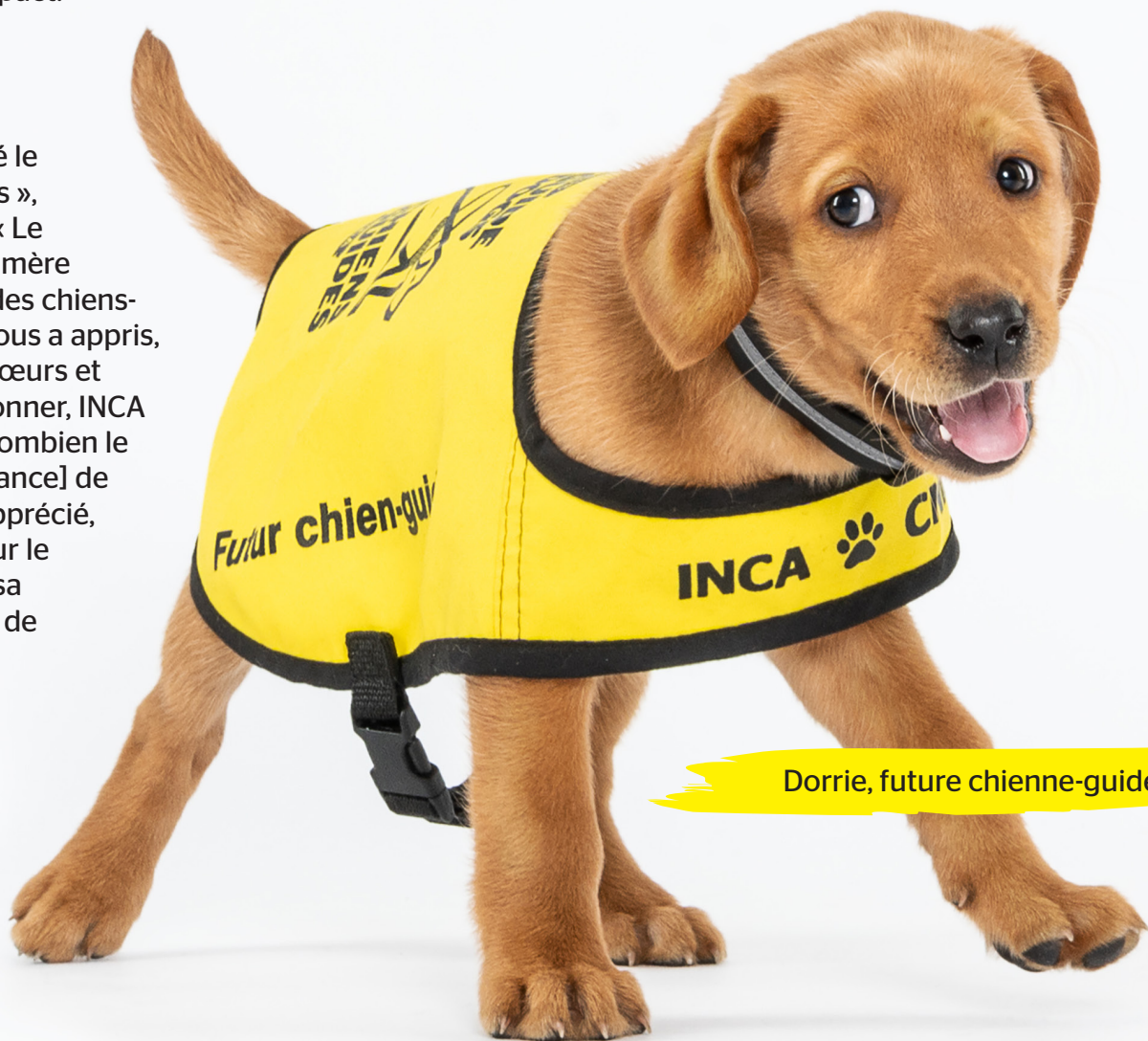
Dorrie, future chienne-guide