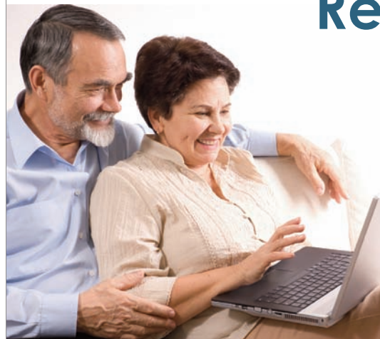
Répondez au sondage en ligne et gagnez un prix!

Nous aimerions savoir ce que vous pensez du nouveau Vision et ce que vous aimeriez y lire.