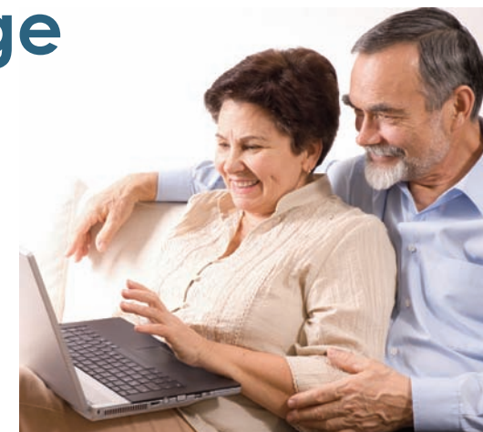
Répondez au sondage en ligne et gagnez un prix!

Pour consulter le règlement du concours ou pour participer au sondage, visitez inca.ca/sondagevision .